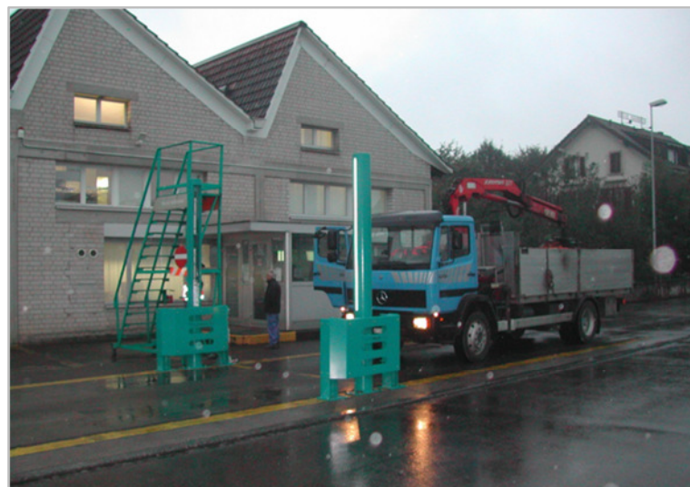
La balance pour les camions étant parallèle à la route de passage et sans séparation évidente, les colonnes nécessitaient une protection solide. Aussi, pour une meilleure visibilité lors de conditions de vue restreinte des bandes LED sont montés le long des colonnes. Lors de cette installation, les installations à 32-canaux existantes sont mis à jour avec des nouveaux ordinateurs permettant l'utilisation des logiciels actuels avec 1024-canaux, donnant la possibilité d'identification des nuclides.

Ces colonnes sont vues très positives par beaucoup de nos clients. Chez Thommen à Kaiseraugst, par exemple, des colonnes similaires étaient demandées par le client.