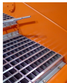
TRIAGE / TAMISAGE