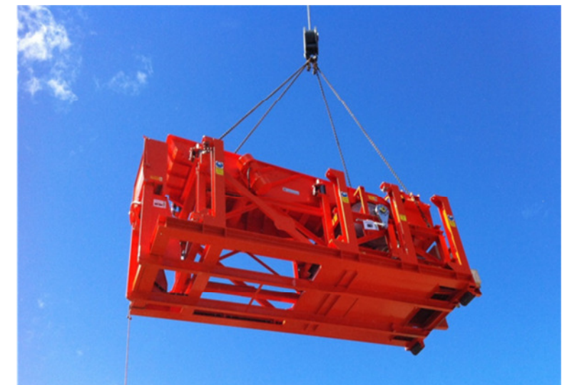
Une installation de séparation de fer magnétique semi-mobile permettant la séparation soit de grosses pièces de rail de chemin de fer soit que des canettes d'Alu et de fer blanc.