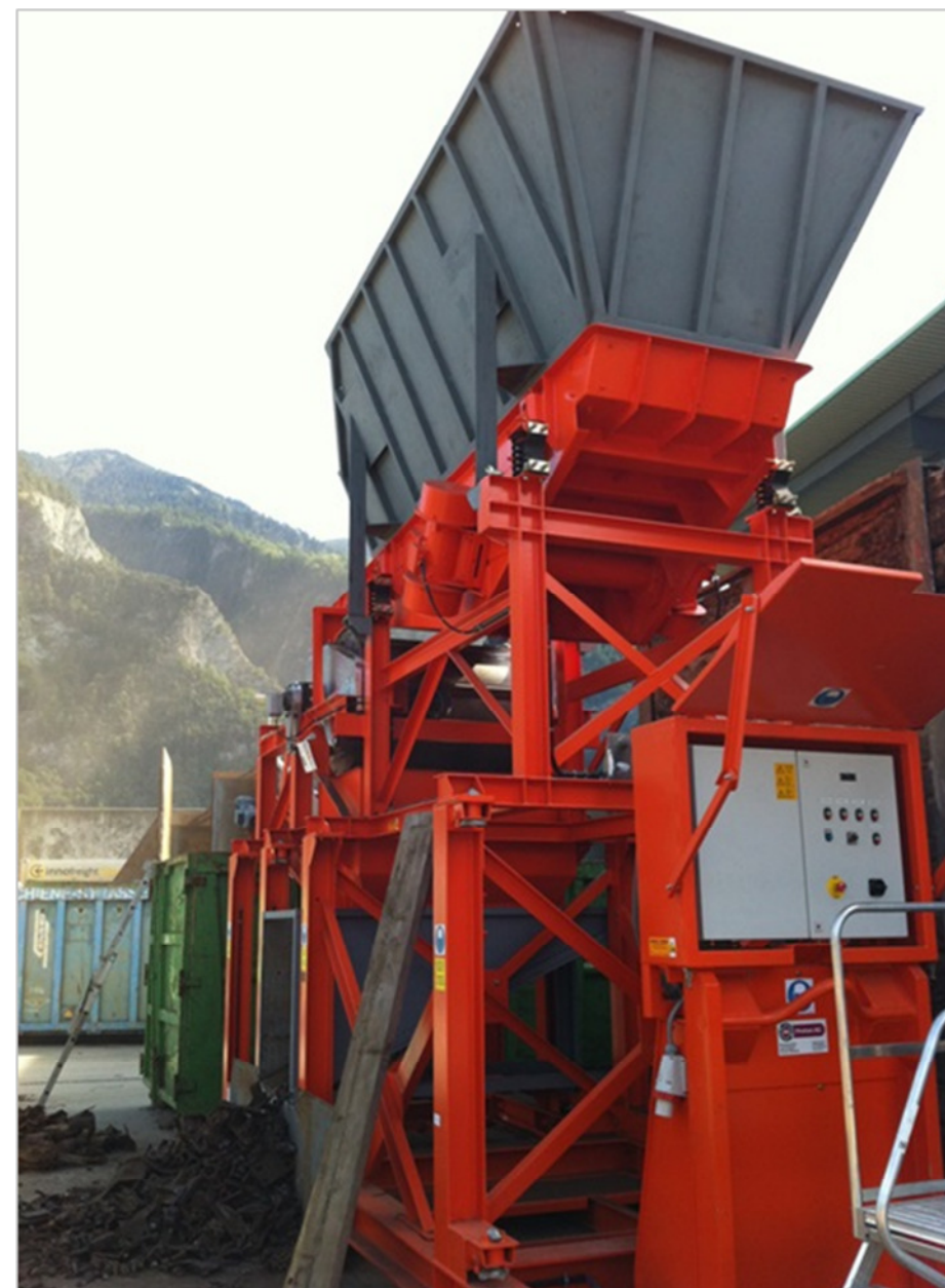
Pour le transport sur Camion ampliroll la trémie se démonte très simplement et le vibro-convoyeur et le tambour magnétique sont rétractables.