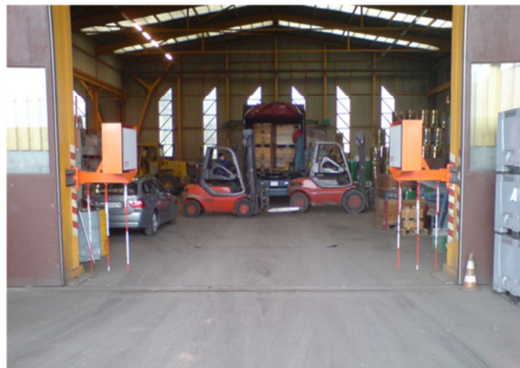
Exemple l'installation de détection de radioactivité pivotant, réalisée chez Cablofer, permettant une détection précise et l'utilisation de la largeur complète du portail d'entrée de la halle.

... à grand avantage pour nos clients, sont ainsi réalisées.