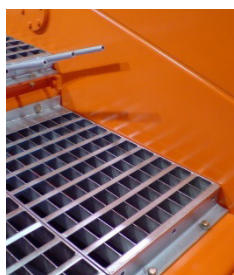
TRIAGE / TAMISAGE