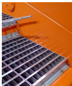
SIEBEN / SORTIEREN / TRENNEN